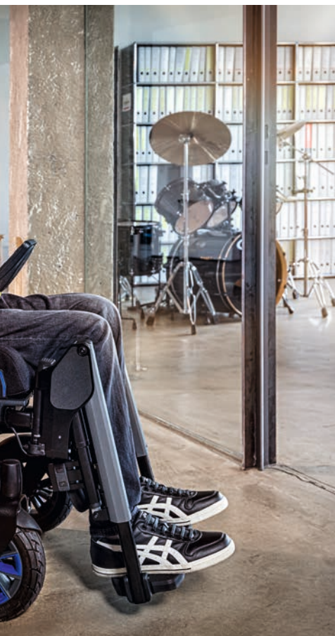
Mit Allradfederung und elektrischer Lenkradretterung (noch in Entwicklung).