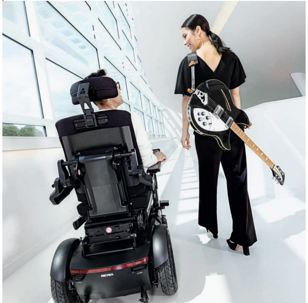
Stylish, modernes Design mit mattschwarzer Vollverkleidung